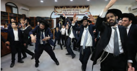
שישו ושמחו בשמחת התורה