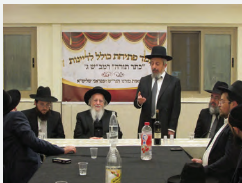
הגר"ש מחפוז נושא דברים במעמד