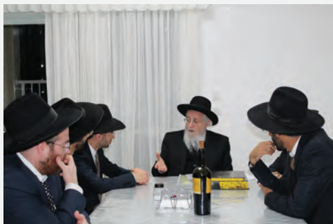
אברכי הקהילה במעונו של מרן הגאב"ד שליט"א

שעה קלה לאחר השלמת רכישת בית המדרש, התקיים שיעור בהלכה לאברכים ששהו במקום מאת רב הקהילה שליט"א, ולאחר מכן פרצו הציבור באופן ספונטני בריקודים ובשירת "אבן מאסו הבונים הייתה לראש פינה".