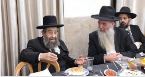
הגר"מ בן שמעון שליט"א במעמד