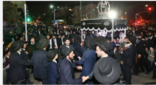
ציבור המשתתפים בתהלוכה

זכותא שליט"א רב צפון העיר בני ברק, זכתה להכניס ס"ת מהודר. לרגל חשיבות האירוע - ציר זבוטינסקי כולו נחסם לשעה קלה ע"י המשטרה