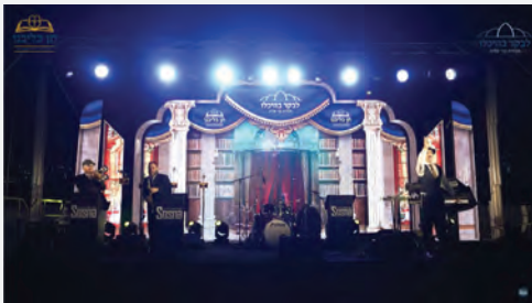
פעילות חוויתית בין הזמנים לאלפי בני הישיבות