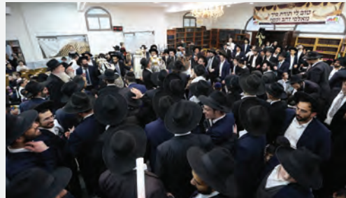
אשורר שירה לכבוד התורה, הריקודים נמשכו שעות ארוכות

ברוב פאר והדר והמון חוגג התקיים מעמד הכנסת ס"ת מהודר לקהילת בני הישיבות בראשות הגר"א זכותא, רב צפון העיר בני ברק.