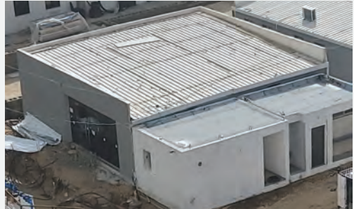
ביהמ"ד "משכן השם"