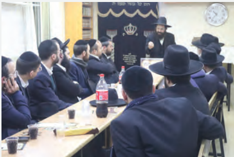
גבאי הקהילות התכנסו

לגודל הבושה והחרפה התברר כי המעשה הנפשע התבצע על ידי אחד מתושבי השכונה אשר סבר כי כך יוכל להרוויח דבר מה, ושילם לישמעאלי אשר בהנאה מרובה ובאמצעות כלי משחית החריב את בית ה' בצורה איזומה ונוראה. למקום הוזעקו עד מהרה כוחות חילוץ והצלה, אשר פעלו לחלץ את ספרי התורה בין ההריסות, תוך שמתפללי ביהמ"ד וכלל תושבי המקום מביטים בהם בעין דומעת ובלב מורתח.