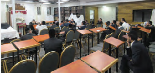
שיעור ספונטני נערך לנוכחים בביהמ"ד