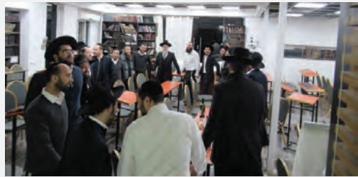
אבן מאסו הבונים הייתה לראש פינה