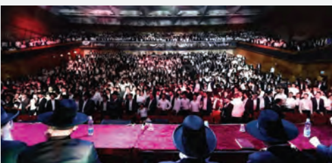
מעמד הסיימים בבנייני האומה בהשתתפות אלפי בני הישיבות הק'

ביותר, וכן במערך שיבוץ וסיוע לבחורים המוצאים את עצמם ללא ישיבה המתאימה להם.