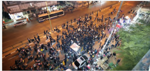
ציר זבוטינסקי נחסם לתנועה