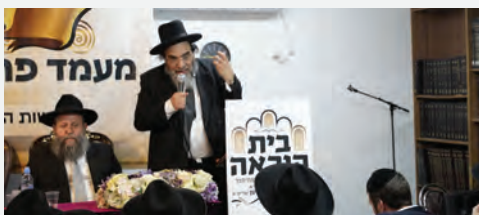
הגר"מ אביעזרי שליט"א