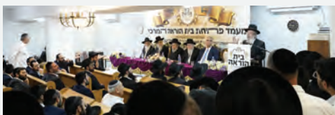
חלק מציבור המשתתפים