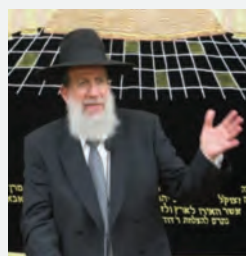
הגר"י כהן שליט"א ר"י נזר התלמוד