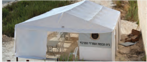
האוהל החדש שהוקם על ידי הקהילה

ברמב"ש ה' המתאכלסת בתקופה זו ממש, כבר התארגנו אברכים עמלי תורה לפעול למען התורה והקמת בית מדרש ראוי לקהילה, וכן הקימו איגוד בני ישיבות למען בני הישיבות בשכונה. זאת בנוסף על פעילות התורה והחסד ההולכות ומתרבות בשכונה.