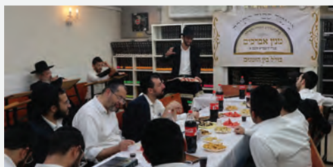
מעמד סיום בין הזמנים