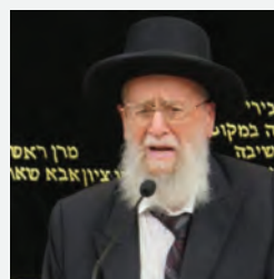
הגר"ד עטייה שליט"א