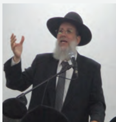
הספד בעיר אשדוד