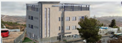
המבנה המוקם בימים אלו ב"ה עבור ת"ת מוסדי עולם

והרחבות כדי להתאים את המקום לכמות התלמידות שגדלה באופן משמעותי, הן בעיבוי הכיתות וכמובן בתוספת מחזור חדש.