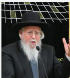
הגרש"י זעפראני שליט"א מרן הגאב"ד