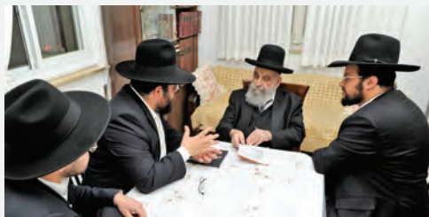
צוות מרכז ההכונן בייעוץ עם מרן ראש הישיבה הגר"מ צדקה שליט"א

שנית - נעשה מאמץ גדול ביותר להגיע אל ספקי המקור האיכותיים ביותר ולבצע רכישה ישירה ונטולת תיווכים, כך שניתן יהיה לספק לציבור את הסחורה המהודרת ביותר במחיר מסובסד ממש.