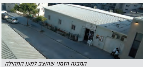
המבנה הזמני שהוצב למען הקהילה