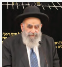
מרן ראש הישיבה הגר"מ צדקה שליט"א בהספד