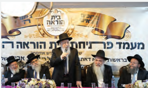
מרן הגאב"ד שליט"א

מעמד מיוחד ורב רושם של הקמת בית דין ובית הוראה מרכזי התקיים בעיר חולון במעמד מרנן ורבנן גדולי ישראל.