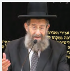
הגר"מ בן שמעון שליט"א