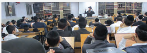
הספד בעיר אשדוד