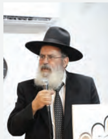
הגר"נ אברז'ל שליט"א