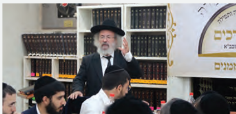
מעמד סיום בין הזמנים