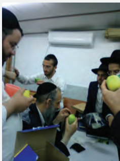
מכירת ד' מינים תשפ"ג

ניתן ומצווה גדולה עד מאוד לתרום לקופת רבותינו ולסייע בביסוסה וחזוקה למען ציבור עמלי התורה, בעמדות נדרים פלוס ובמוקד התרומות בטל' 202-1800.