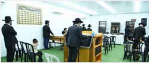
מניין התפילה הראשון בביהמ"ד החדש!