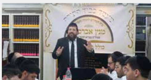
מעמד כבוד התורה