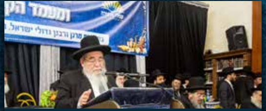
מִן ראש הישיבה הגאון הגדול רבי אברהם סלים שליט"א ראש ישיבת "מאור התורה" וחבר מועצת חכמי התורה