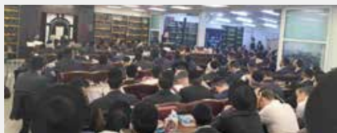
עצרת בקהילת חניכי הישיבות בית וגן קרית היובל

כמו כן, קראו מרגן ורבנן גדולי התורה שליט"א להתחזק ולהוסיף שעות לימוד ותפילה למען כלל ישראל, ובמיוחד כעת כאשר הזמן החולף נותן את אותותיו, וגובר הסיכון שכוח