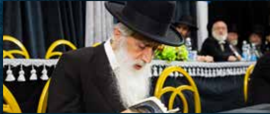
ראש הישיבה הגאון הגדול רבי יהודה כהן שליט"א ראש ישיבת יקירי ירושלים וחבר מועצת חכמי התורה