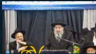
הגאון הגדול רבי שלום ביטאן שליט"א ראש ישיבת "דעת חיים"