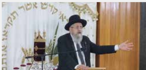
הגאון רבי אברהם דיי"ן שליט"א בעצרת חיזוק והתעוררות שנערכה בק"ק עטרת אברהם - נווה יעקב לאור המצב, ובמלאת עשור לפטירת מרן רבנו הגר"ע יוסף זצוק"ל