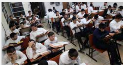
כולל חנוכה בקהילת מנין אברכים קרית שמואל

בחישוב סך השעות שנלמדו במשך ימי החנוכה עלה מספר עצום של 380 שעות לימוד, כאשר סך המילגות שחולקו ללומדים עמד על 22.000 ₪. גדול היה המעמד לכבודה של תורה.