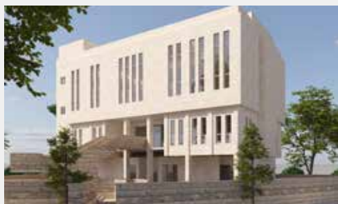
הדמיית ביהמ"ד העתידי אי"ה שע"י קהילת אהל משה

אך לאורך השנים הקושי הגדול של הקהילה היה היעדר מקום בביהמ"ד, בהיות הקהילה שוכנת במשכן ארעי וזמני המבוסס על דירה גדולה בקומת קרקע שאוחדה לכדי ביהמ"ד המכיל כ-120 מקומות.