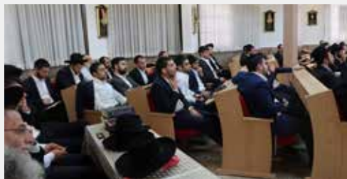
עצרת במנין אברכים קרית שמואל - טבריה