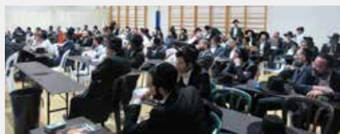
עצרת בקהילת 'מסילת ישרים' רמות א'

התורה ייחלש ר"ל מה שעלול לגרום לאסונות נוספים ל"ע, ודאי יש לתת את הדעת להוסיף במיזמים ובהתחזקויות שונות להגביר את כוח התורה והתפילה ולעורר רחמי שמיים ביתר שאת, למען שמירת כלל ישראל והצלחת המערכה.