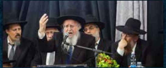
מִן הגאב"ד הגאון הגדול רבי שלמה זעפרמני שליט"א נשיא קהילות עמלי התורה ר"כ ואב"ד "כתרו תורה"