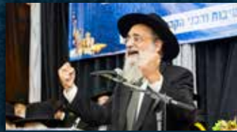
הגאון הגדול רבי יעקב שרגאני שליט"א מראשי ישיבת "מאור התורה"