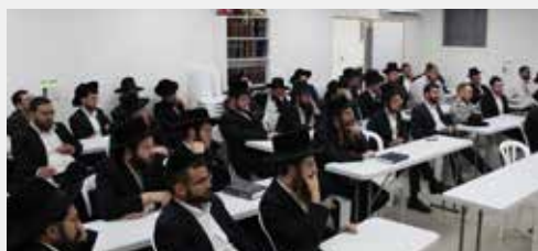
עצרת בקהילת בני הישיבות ב"ש רמה ה'