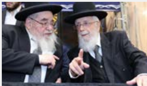
מרן ראש הישיבה והגר"מ טולידנו שליט"א