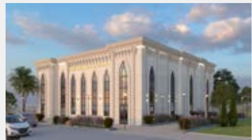
מבנה הפאר המיועד לקום אי"ה במרכז השכונה באופקים

בימים אלו ממש מתנהל קמפיין היסטורי לקראת פתיחת מגבית 'בית חיינו' למען בית המדרש, ואירוע התרמה חסר תקדים ייערך אי"ה לקראת חודש אדר. לוח הקהילות ימשיך לעקוב ולסקר את הפעילות בקרוב.