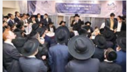
מנן הגאב"ד שליט"א מלהיב את בני הישיבות בדברים