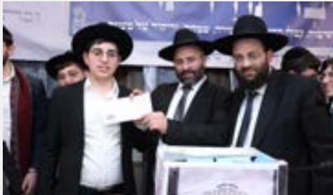
מעמד חלוקת הפרסים לבחורים הזוכים

כן השתתפו ונשאו דברים הגאונים הגדולים הראשלי"צ רבי יצחק יוסף שליט"א, רבי משה פנירי שליט"א - ראש בתי ההוראה "אפיקי מים", רבי רחמים זיאת קצין שליט"א - משגיח בישיבת אבני נזר, רבי טל דואר שליט"א - מו"ץ שכונת רמות, רבי יורם מימון שליט"א - ראש ישיבת "תורת משה", רבי נפתלי אברג'ל שליט"א - רב קהילות האברכים בנווה יעקב ובק"ס, רבי זמיר כהן שליט"א - ראש ישיבת "אבני נזר", רבי אשר חמוי שליט"א - מראשי ישיבת "אבני נזר", רבי יצחק מאיר סעדון שליט"א - מראשי ישיבת "תורת יהודה"