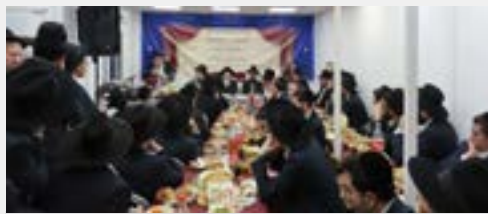
מרנן ורבנן שליט"א במעמד ההכתרה

המעמד החל בדברי פתיחה על חשיבות המינוי רב לקהילה, ועל הזכות ליישם זאת כהמשך רציף להתעצמות ופריחת הקהילה, כרכיב נוסף המרומם את בני הקהילה כולם. עוד דובר על הדיונים ועל ההסכמה כי הגר"ב שליט"א הינו הראוי והמתאים ביותר לתפקיד, עד כי המינוי כמו מתבקש מאליו.