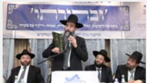
הגאון רבי רחמים זיאת קצין שליט"א נושא דברים