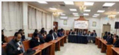
כנס הקמת איגוד בני התורה מהקהילה האתיופית

בעלותם ארצה לפני כיוכל ואת מאמצם הכביר לשמר מורשת אבות במסירות נפש עצומה, לאחמ"כ הוא תיאר את הפריחה העצומה הקיימת כיום בקרב בני התורה מהקהילה ברחבי הארץ.