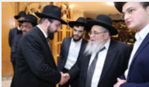
מרן ראש הישיבה שליט"א בכניסתו לכנס