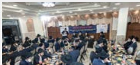
קהל הגבאים בכנס שע"י קופת רבותינו

הכנס נערך במוצש"ק פ' משפטים בסימן "שמוע אשמח צעקתם", במטרה לחזק את כח הצדקה בציבורנו וכן לחיזוק הרישום לקרן למחייתם. קרן למחייתם הוקמה לפני שנתיים במטרה לתת מענה למחייה חודשית של יתומים, על פי מודל הקרן, כל יתום שהוריו הצטרפו לקרן בחייהם (ובמצב בריא) יקבל קצבה חודשית ע"ס אלף וחמש מאות ש"ח ללא כל תנאי עד הגיעו לחתונה או גיל כ"ב שנים.