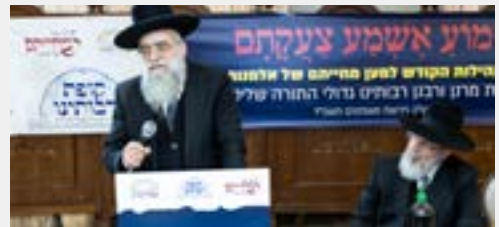
מורנו הגר"י אביטן שליט"א נושא דברים בכנס

מורנו הגאון הגדול רבי יעקב אביטן שליט"א - רב קהילות האברכים באחיסמך ובק"ס ומרבני קופת רבותינו השתתף גם הוא, וחדד את החשיבות הרבה לציורף בני הקהילה לקרן מבעוד מועד, ועל חובתם של הגבאים לפעול למען כך, היות ובמקרי אסון ל"ע עול היתומים נופל גם על גבאי הקהילה.