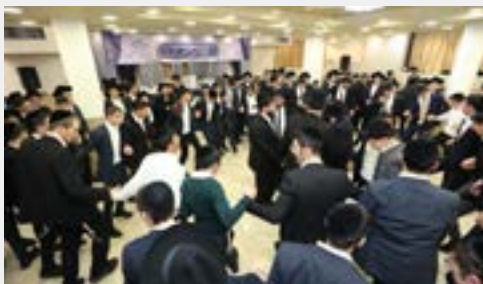
שירה וריקודים לכבודה של תורה