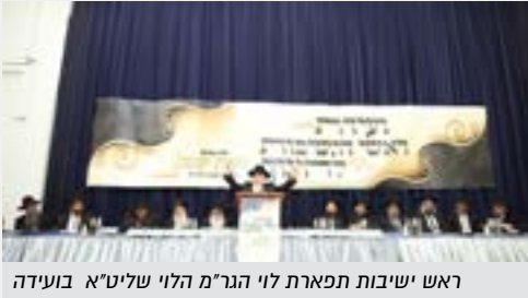
ראש ישיבות תפארת לוי הגר"מ הלוי שליט"א בועידה