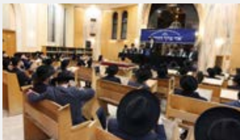
בני הישיבה בכינוס