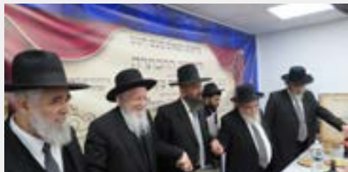
ריקוד בשמחה של מצוה

גדו"י נשאו מדברותם, וכן האזינו ברוב קשב לדרשת ההכתרה של הגר"ב שליט"א אשר פתח בשבת והודיה לבורא עולם על הזכות לכהן כרב בקהילת עמלי תורה הספונים באוהלה של תורה, והרחיב וביאר יסוד עצום בסוגיית מצוות יציאת זכירת מצרים, וביישוב מספר קושיות בדברי הרמב"ם בסוגיא מכוח זה.