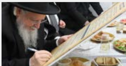
מרן הגאב"ד שליט"א חותם על כתב ההכתרה