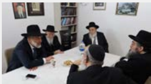
ייעוץ עם מרנן ורבנן במעונות של מרן רה"י שליט"א

בין הערים בהם זכתה התנועה להצלחה רבתי ולהישגים חסרי תקדים הרבה בזכות פעילות האברכים, ניתן למנות את בית שמש, אלעד, רכסים, חריש, טבריה, אופקים ועל כולם - ירושלים עיה"ק.