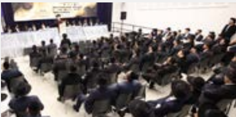
חלק מציבור המשתתפים