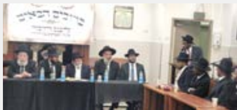
נציג האיגוד נושא דברים בפני הרבנים שליט"א

לאחר מכן נשא דברים מרן הגאב"ד הגאון הגדול רבי שלמה ידידיה זעפראני שליט"א שהביע את שמחתו העצומה, ודיבר על כוח ההשפעה ונקודת המבט הנכונה הנדרשים מאברך ספרדי בן-תורה בודורנו, ועל החשיבות הרבה לכך שהתעוררו אברכים נמרצים מבני הקהילה האתיופית לדאוג לכלל בני הקהילה.