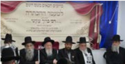
מרנן ורבנן שליט"א במעמד ההכתרה

אחר מספר שנות פיתוח בלתי פוסק של הקהילה ואחר שבית המדרש עבר שיפוץ נאה, חשו בני הקהילה את הצורך במינוי רב אשר יגדלם ויכוון בעבורם את הדרך באופן תדיר ותמידי.