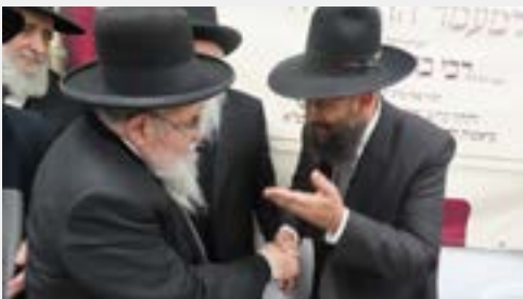
הגר"ב מקבל את פני מרנן רה"י שליט"א

אחר תקופה בה שהה הגר"ב רבות בקהילה ומסר שיעורי הלכה ושיחות חיוזוק, נערך מעמד מכובד ורב רושם סביב שולחנות ערוכים לכבודה של תורה, בהשתתפות מרנן ורבנן גדולי ישראל שליט"א ומאות מתושבי העיר אשר באו לכבד את המעמד ולקבל את פניהם.